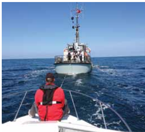
"På slæb efter "Manø". Jeg flyttede mig lige efter billedet blev taget"