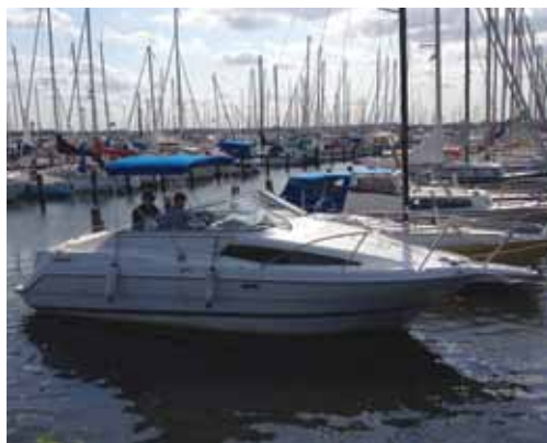
"Lady Di" af Marbæk. En Bayliner 26.

I skønt vejr sejlede vi ud af Marbæk Havn og påbegyndte den navigationsmæssigt krævende tur til udsejlingen af Roskilde Fjord. "Lady Di" stikker kun 0,9m, men hun går 23 knob, så en vis forsigtighed og konservatisme er påkrævet.