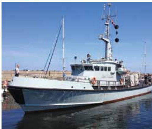
MHV 902 "Manø"

Vi takker "Manø" for veludført redning, og vinker til dem, mens de bakker ud af havnen og genoptager turen til Aalborg.