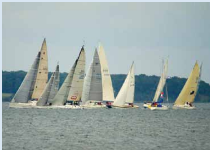
"Tirsdagssejladserne er startet på efterårs sæsonen" med gode minder om en vellykket forårssæson.