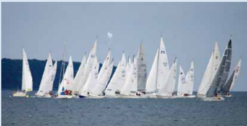
1. start tirsdag den 25. juni 2013"